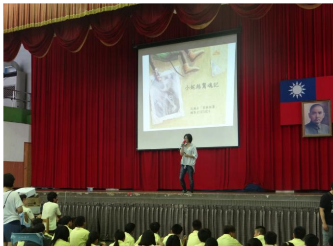
圖片說明：改編繪本說故事