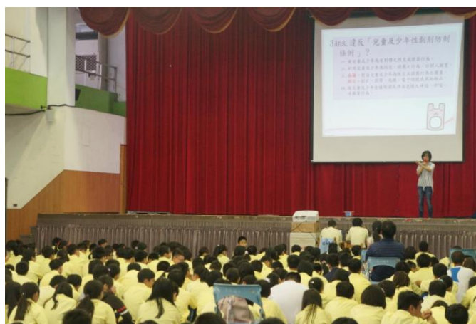
圖片說明：說明性剝削條例