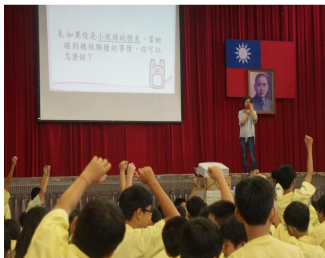
圖片說明：有獎徵答，學生踴躍回答