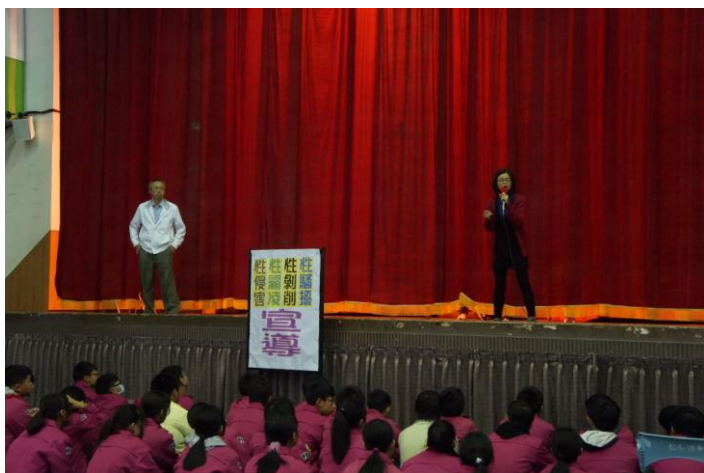
圖片說明：說明各項防治教育