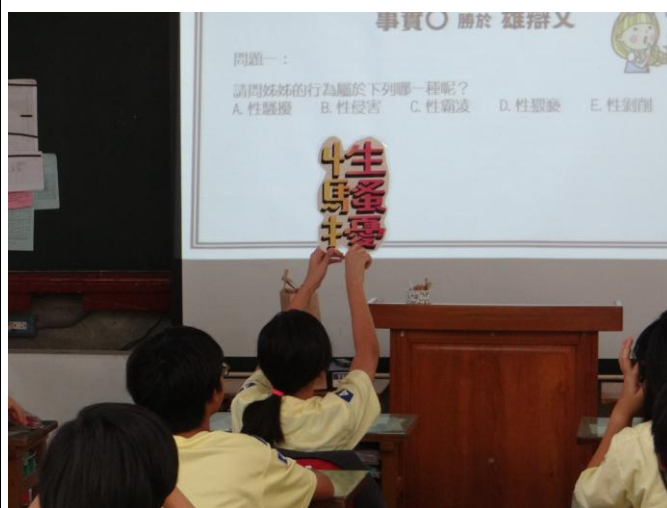
圖片說明：學生舉牌辨識