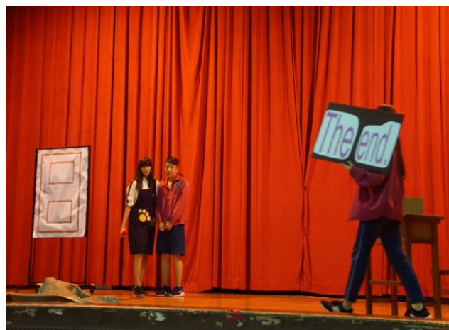
圖片說明：辦理短劇進行宣導