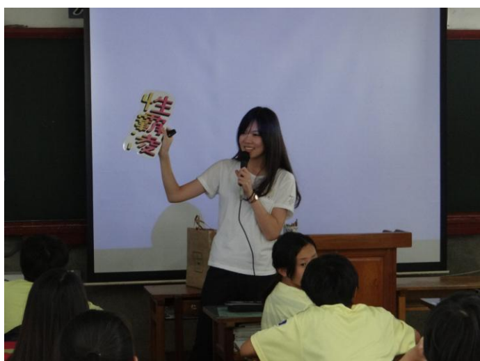
圖片說明：入班進行宣導