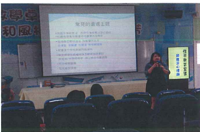
說明：講師對老師說明青少年常見的處遇主題