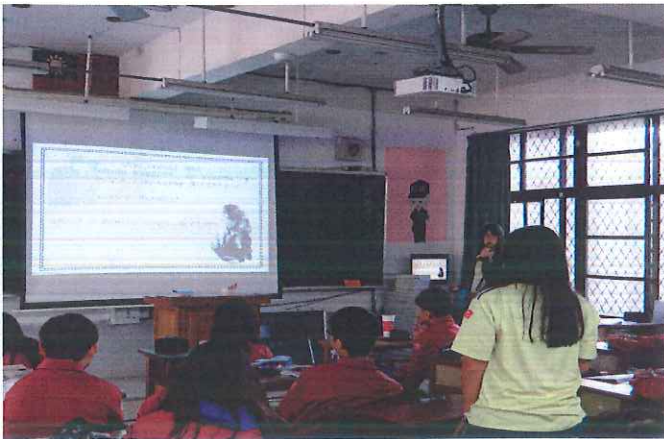
說明：專輔教師請同學說明他的想法