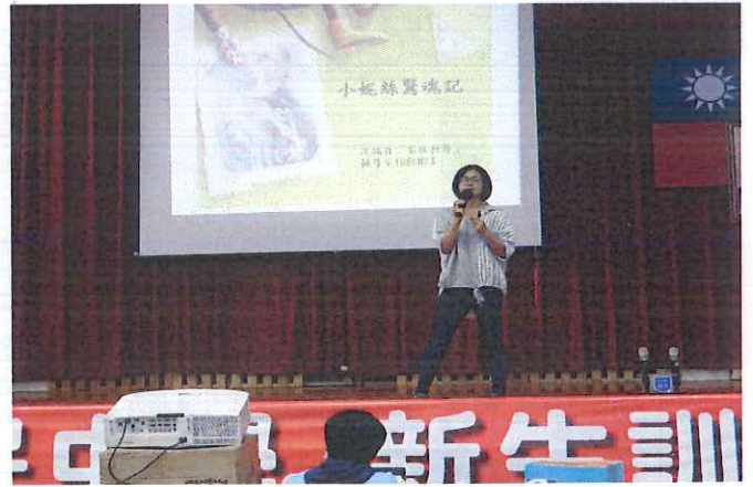
說明：說故事當引導