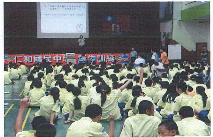
說明：同學們踴躍回答問題