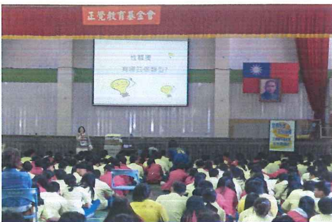
說明：講師說明性騷擾的類型