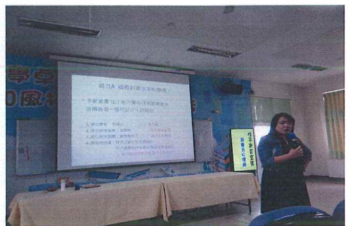
說明：講師指導老師該如何做？