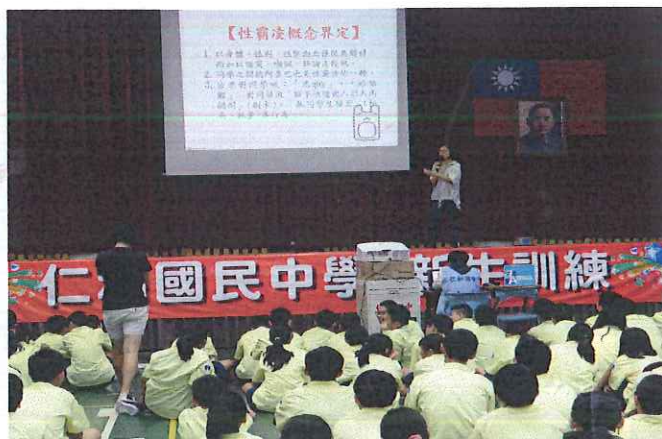
說明：從故事中引申談性霸凌的概念