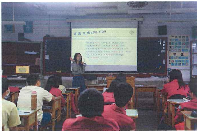
說明：專輔入班--「仙杜瑞拉的旅程」