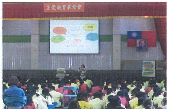
說明：講師舉例說明性霸凌