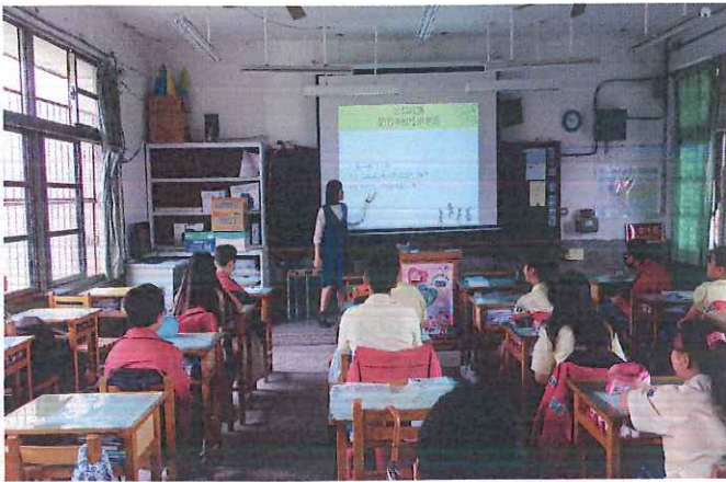
說明：親職日影片賞析說明