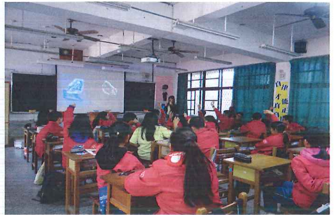
說明：同學們踴躍回答問題